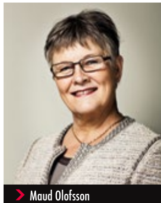
> Maud Olofsson