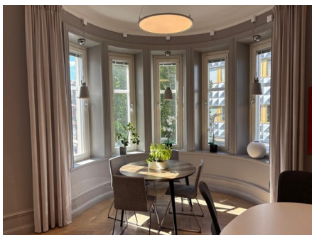
Bergsmärlagen 42 Customer ref: 0810012215