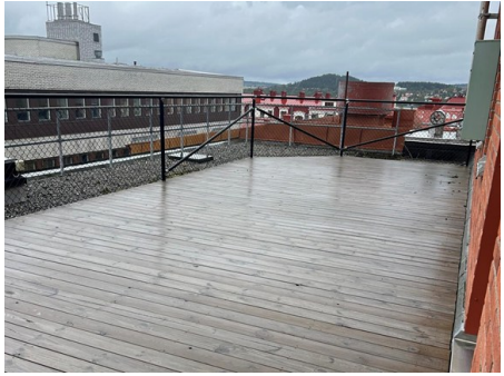
PLAN 3 POSTILJONEN 6